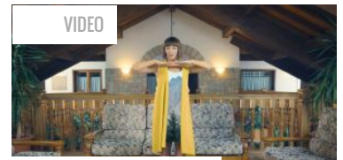
Il nuovo videoclip di Meg R...