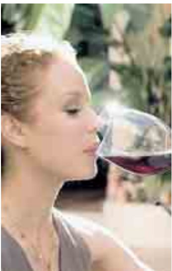
Castagne e vino rosso