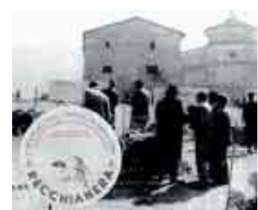
Foto d'epoca per il pecorino