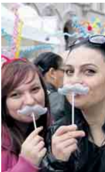
Finale di Eurochocolate