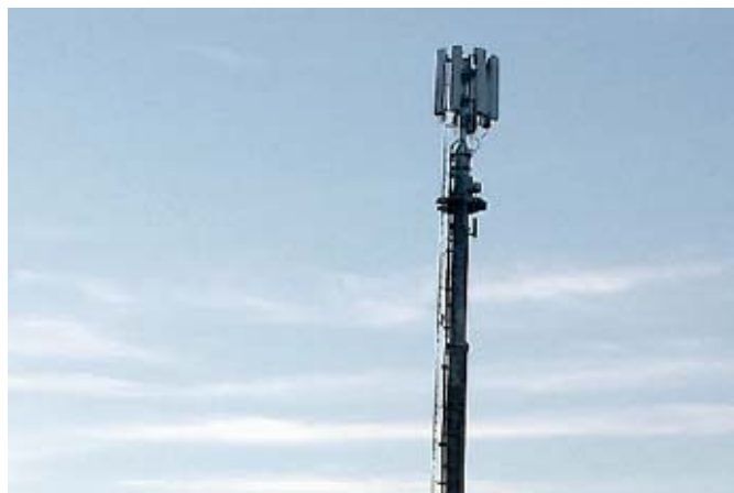
L'antenna della Wind che sta spaccando il consiglio comunale di Castel di Lama

La contesa tra le due parti in causa è iniziata durante lo